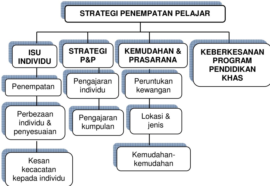
Rajah 1 : Ringkasan rangka kursus